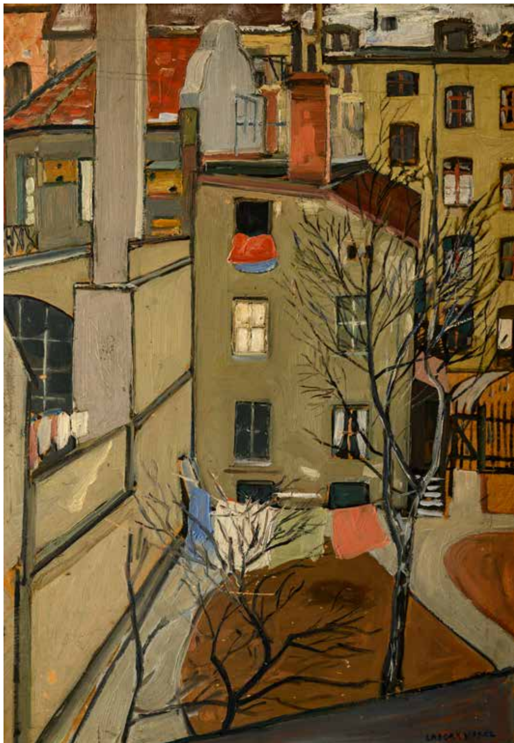
Lascăr Vorel, Vedere din atelier